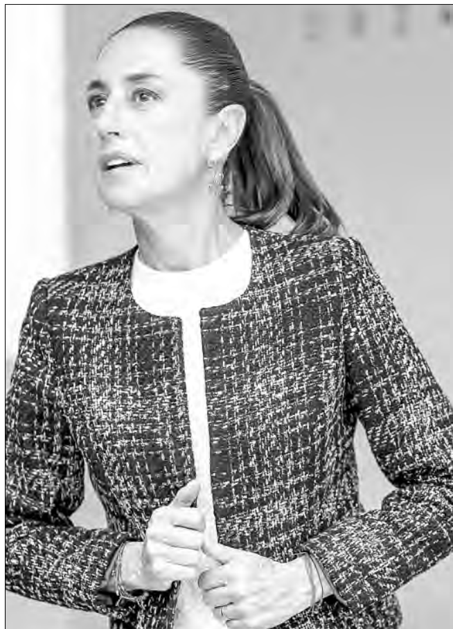
▲ “La gira conjunta con López Obrador ha sido de mucho aprendizaje y para que el pueblo vea que es un mismo proyecto: continuidad con mi estilo”, dijo la presidenta electa.