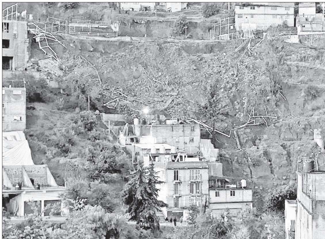
▲ Aspecto del un deslizamiento de rocas ocurrido ayer en la parte alta de San Miguel Dorami, en Naucalpan, estado de México, donde falleció un bombero de protección civil que evaluaba riesgos.

El gobierno del estado de México informó que 228 casas de los municipios de Coacalco y Ecatepec fueron afectadas por las lluvias y el