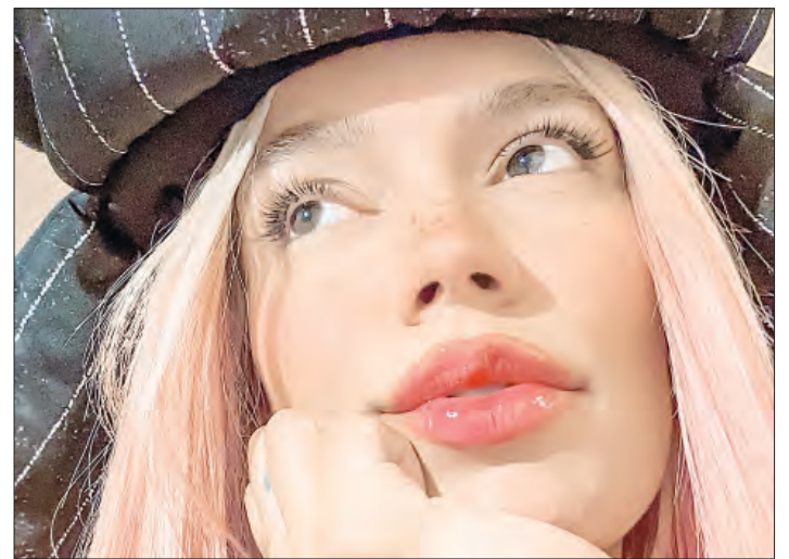
▲ La compositora y cantante colombiana Karol G.

Por tercera ocasión en su historia los Grammy Latino se celebrarán en Miami, tras una edición 2023 efectuada en Sevilla, España.