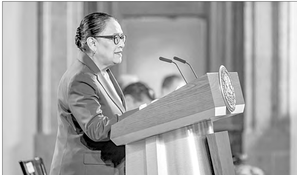
▲ La actual secretaria de Seguridad y próxima de Gobernación, Rosa Icela

Facebook, TikTok, Twitter: galvanochoa Correo: galvanochoa@gmail.com