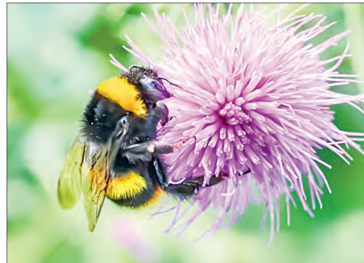
▲ Un abejorro poliniza una flor silvestre.

“El campo comparativo de la memoria episódica está, por lo tanto, maduro para ser llevado más allá de nuestros paradigmas establecidos y viejos debates, y hacia una fase más madura y constructiva.”