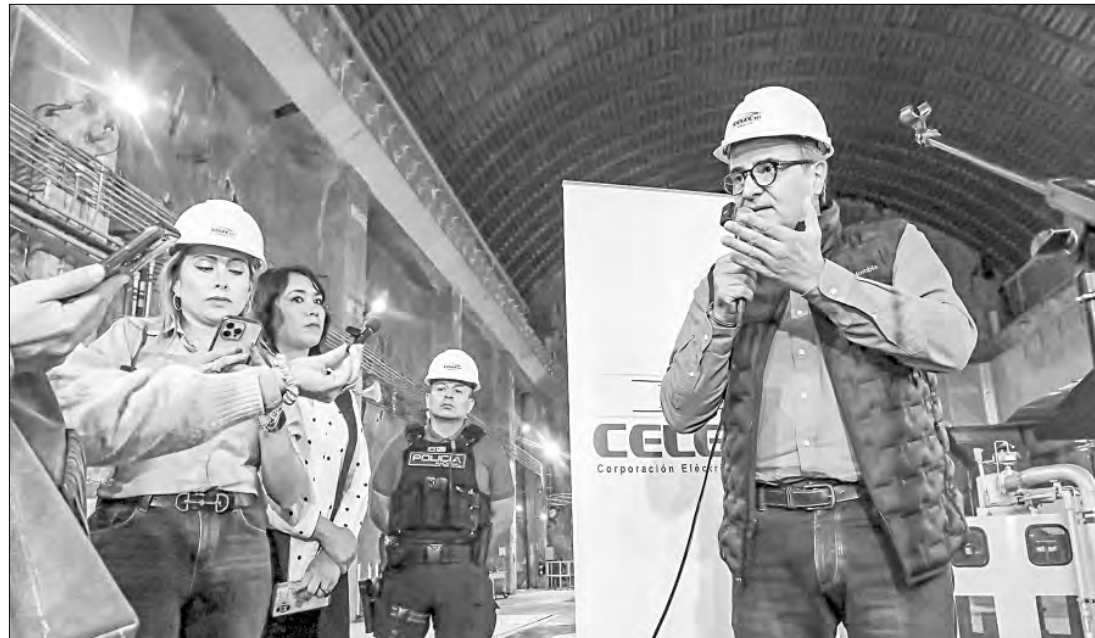
▲ El ministro de Energía de Ecuador, Antonio Goncalves, ofreció una conferencia de prensa en la planta hidroeléctrica Mazar, en Las Palmas, para dar detalles sobre los apagones generales de ocho horas con los cuales el gobierno busca

hacer frente a la peor sequía en 60 años, que amenaza la operación de sus plantas generadoras, una de las cuales se encuentra bajo vigilancia militar. El plan incluye teletrabajo para empleados del sector público.