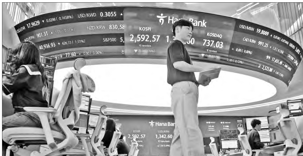
▲ Los mercados accionarios de todo el mundo están pendientes de la magnitud del recorte de tasas que decidirá la Reserva Federal de Estados Unidos en su reunión de hoy.

El posible estímulo a la economía que podría otorgar un recorte de 0.50 puntos porcentuales, unido a los efectos de los huracanes que amenazan a la industria petrolera de Estados Unidos, alejan el precio del crudo de sus recientes mínimos. Los futuros del crudo estadounidense sumaron 1.10 dólares, equivalente a 1.57 por ciento, a 71.19 dólares. En tanto, los futuros del Brent subieron 95 centavos, o 1.31 por ciento, a 73.70 dólares por barril. La mezcla mexicana cerró en 65.70 dólares.