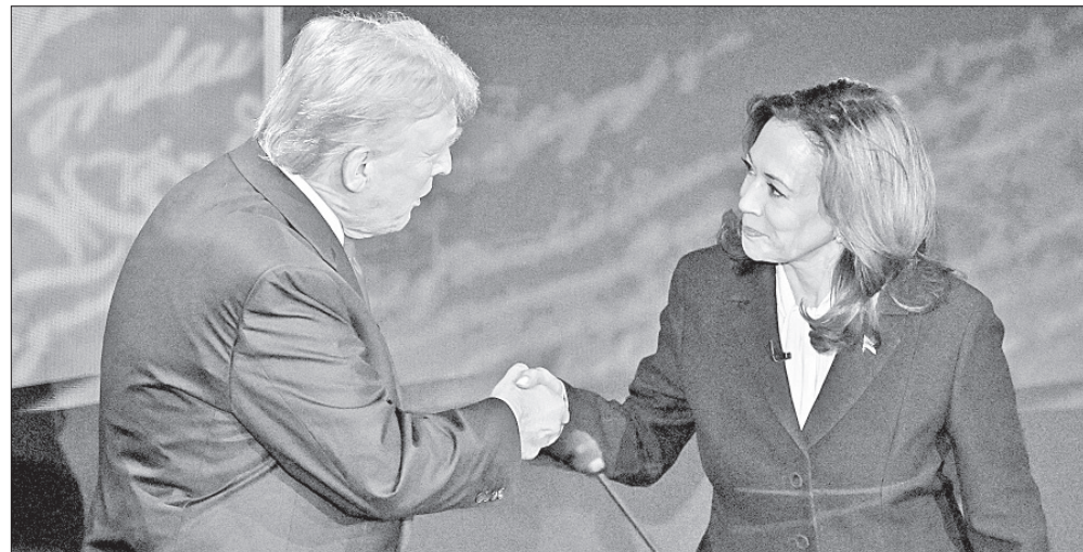
▲ El candidato republicano Donald Trump y la vicepresidenta y aspirante demócrata

http://alfredojalife.com • https://www.patreon.com/alfredojalife • https://www.facebook.com/AlfredoJalife • https://vk.com/alfredojalifeoficial • https://t.me/AJalife • https://www.youtube.com/channel/UCIfxfjOThZDPL_cOLd7psDsw?view_as=subscriber • https://vm.tiktok.com/ZM8KnkKQn/ • https://twitter.com/AlfredoJalife • Instagram: @alfredojalifer