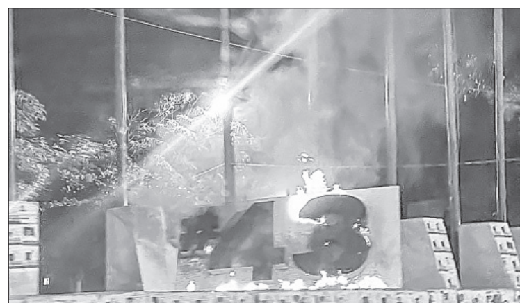
▲ Testigos informaron que la quema en el antimonumento a los 43 comenzó alrededor de las 20:30 horas.

Es la segunda ocasión que se comete un acto vandálico contra el antimonumento a los 43 normalistas, ubicado en la avenida Lázaro Cárdenas, ya que en septiembre de 2022 un grupo de individuos lo quemó durante la madrugada.