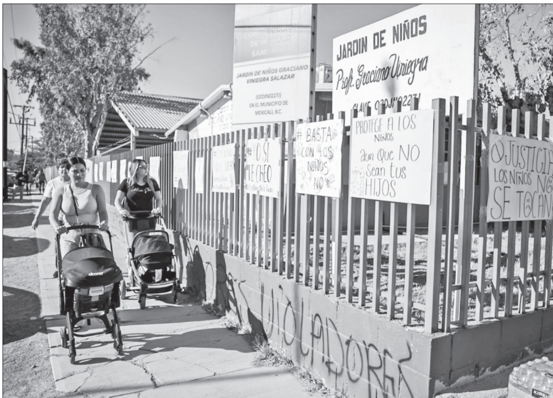
▲ Carteles con consignas como "Protege a los niños aunque no sean tus hijos", "Yo sí te creo" y "No queremos ser silenciados", fueron colocados ayer por familiares de estudiantes del jardín de niños

"Mi corazón está partido en mil pedazos, pero ni así me callaré y haré justicia por mi bebé. Ayúdenme a compartir", expresa en la grabación.