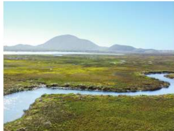
San Quintín, B. C.