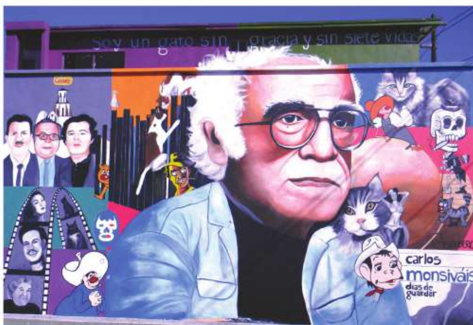
Mural Homenaje a Carlos Monsiváis de la artista Ariana Escudero, ubicado en el centro de Tijuana.

El diálogo con el proceso chicano, ocupó su interés desde mediados de los años setenta en la ruta que va de Tijuana, al este de Los Ángeles. Otro aspecto