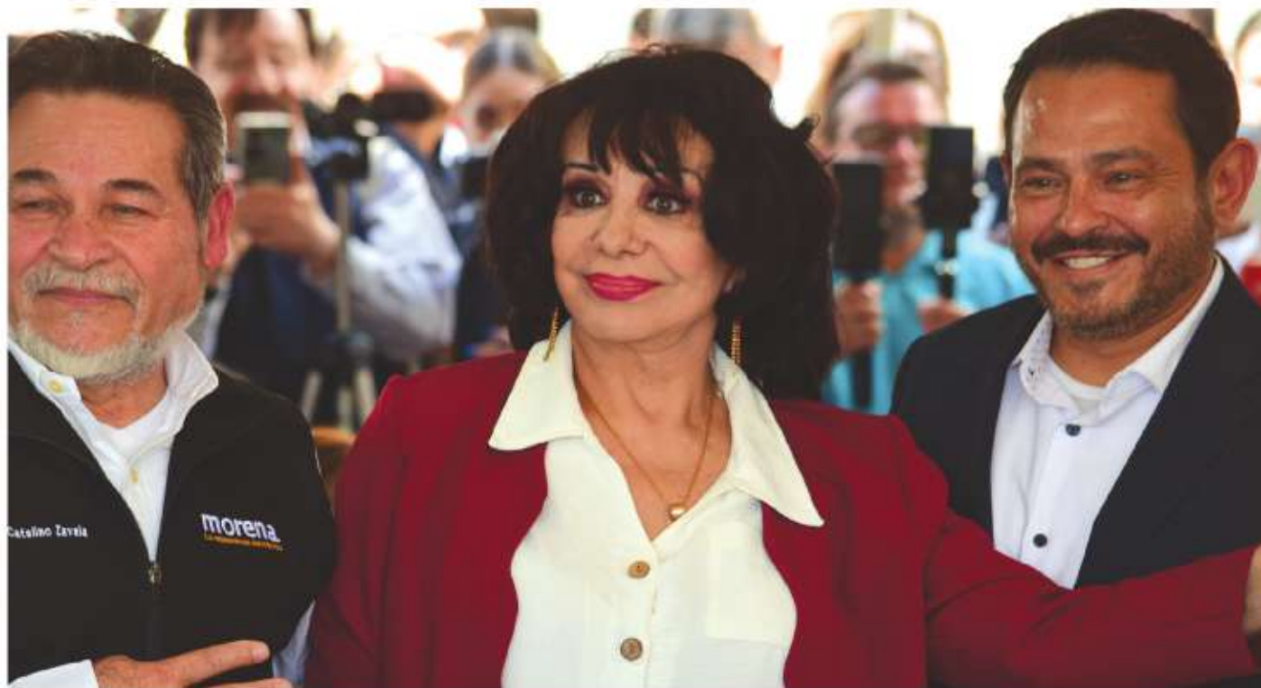
La actual alcaldesa de Mexicali, Norma Bustamante.

Es por todo esto que debemos salir a las calles e invitar a nuestros familiares, amigos y vecinos a votar por Norma Bustamante el próximo 2 de junio, para consolidar la transformación y avanzar hacia un futuro aún mejor para todos.