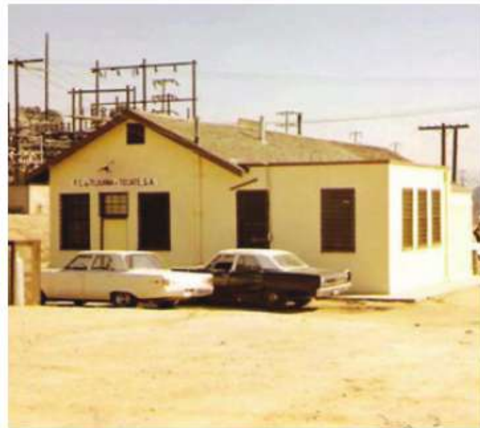
Esta estación es un excelente ejemplo del estilo Prairie de 1919. Diseñada por un arquitecto galardonado en San Diego.