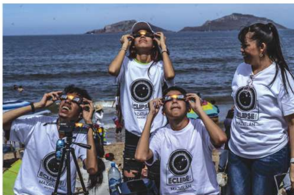
El eclipse visto desde Mazatlán.

autoridades suspendieron clases durante el turno matutino para que los niños pudieran disfrutar el fenómeno.