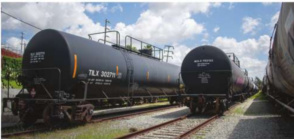
Ubicada en la zona este de Tijuana puede convertirse en un atractivo cultural mediante un uso como museo-jardín.

ter rural y de paisaje cultural digno de ser interpretado y conservado.