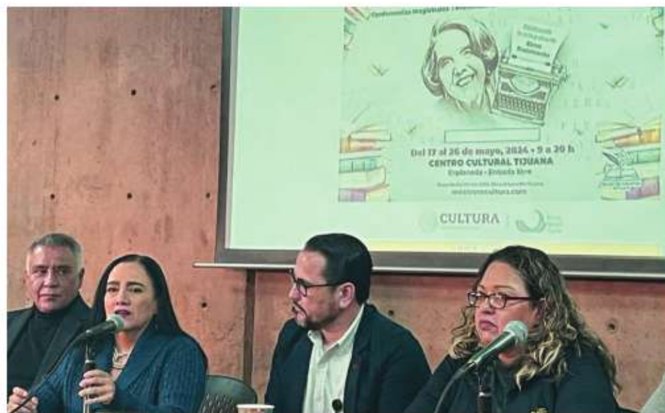
La Feria del Libro de Tijuana se realizará del 17 al 26 de mayo y tendrá como autor invitada a Elena Poniatowska.

Para ello organizaron festivales literarios –y poder participar en uno–; se inventaron concursos de “pluma fácil” (para otorgarse un premio); innovaron excursiones –partiendo de la pizza tardeada– al ángelus de la madrugada; se intoxicaron con viandas sagradas (peli-