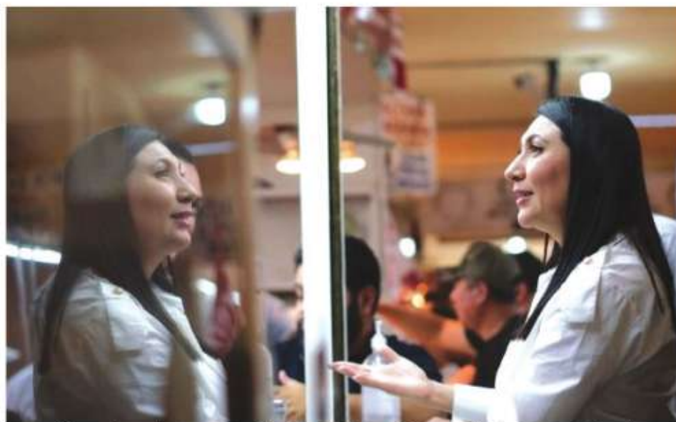
La candidata a la presidencia municipal de Celaya, por Morena, fue asesinada mientras recorría las calles en busca del voto.

La secretaria de Seguridad y Protección Ciudadana (SSPC), Rosa Icela Rodríguez, aseguró en la conferencia