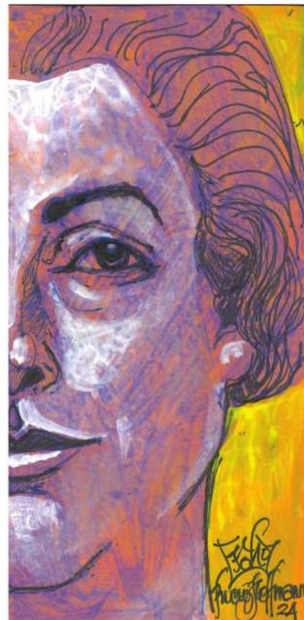
Mujer que sabe latín, ni encuentra marido ni tiene buen fin ... eso rezaba el dicho popular que sirvió a la escritora Rosario Castellanos para reflexionar sobre la condición de la mujer en los años 70 del siglo pasado...

La Jornada Baja California quiere celebrar con sus lectores su noveno aniversario. Y, como en cada ocasión, lo hacemos poniendo sobre la mesa temas de interés primordial.