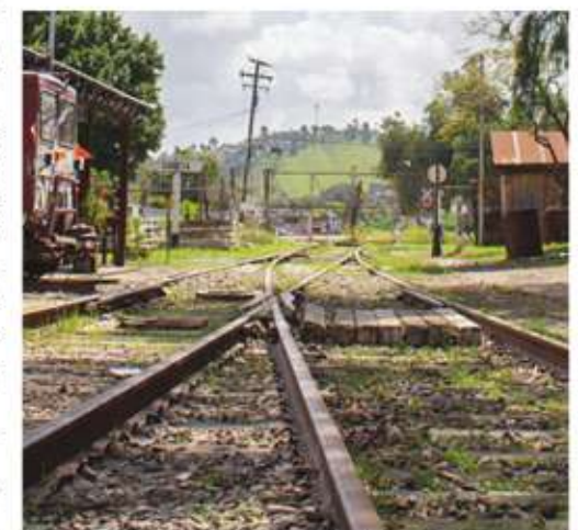
La estación García conserva características rurales.