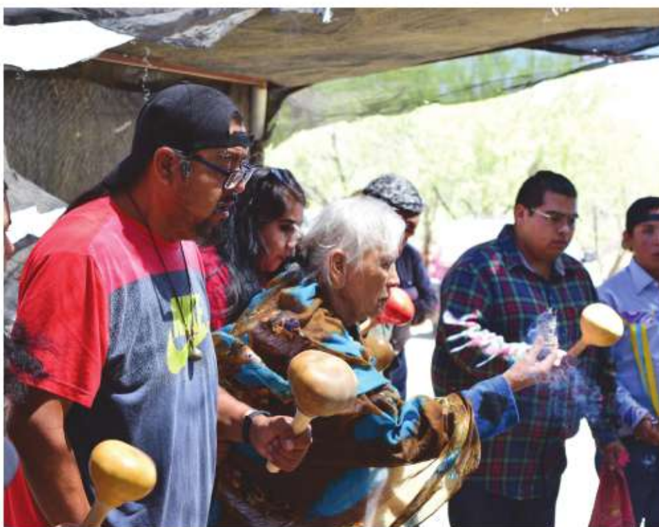
Representantes de los pueblos Yumanos, realizan una ceremonia durante la discusión del plan de Justicia Yumana. Estos pueblos no tienen una representación política en el estado.

Las identificaciones estratégicas pueden utilizarse en procesos de resistencia contra la opresión, pero también participan como dispositivos para perpetuar la desigualdad, la explotación o los intereses económicos y políticos de grupos y clases dominantes, como ocurrió cuando decenas de militantes del PRI (18 en Tlaxcala en mayo de 2021 y 17 en Oaxaca en 2017), se registraron como si