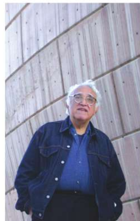
Monsiváis en el Centro Cultural Tijuana, cortesía de Ava Isabel Ordorica.

En esta mirada abarcadora, la frontera emerge como un talismán temático. Una zona de entrevero, refundaciones y cruzamientos delirantes, que encontró a un viajero con la inteligencia, la mirada implacable, pero solidaria, de Carlos Monsiváis.