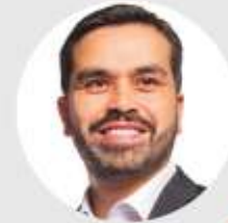
JORGE Á. MAYNEZ

64 senadurías por el principio de mayoría relativa.