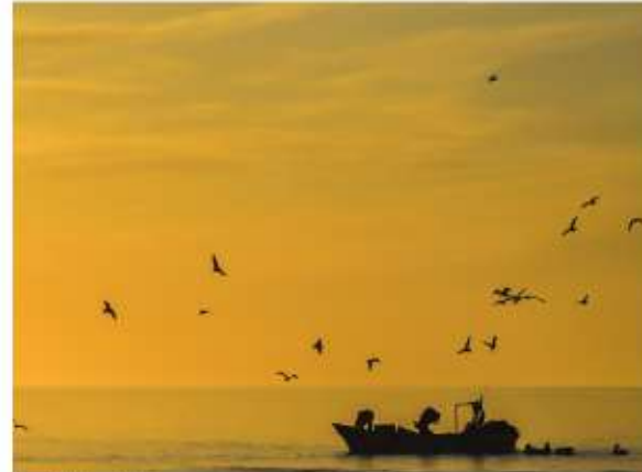
San Felipe, B. C.