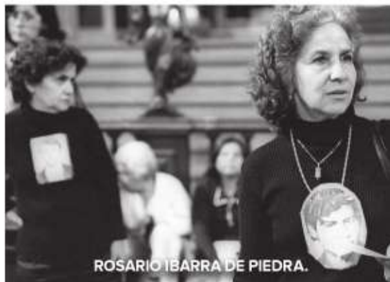
ROSARIO IBARRA DE PIEDRA.