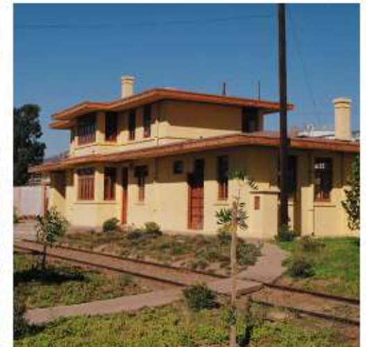
Estación Tecate.

Sin embargo, logró salir adelante, y aunque son poco conocidas por la población, el tramo Tijuana-Tecate tiene tres estaciones con valor histórico: Tijuana, García y Tecate.