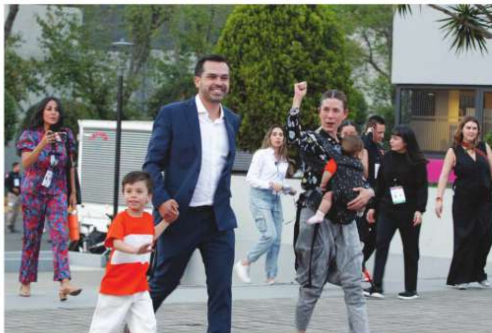
Jorge Álvarez Máynez.