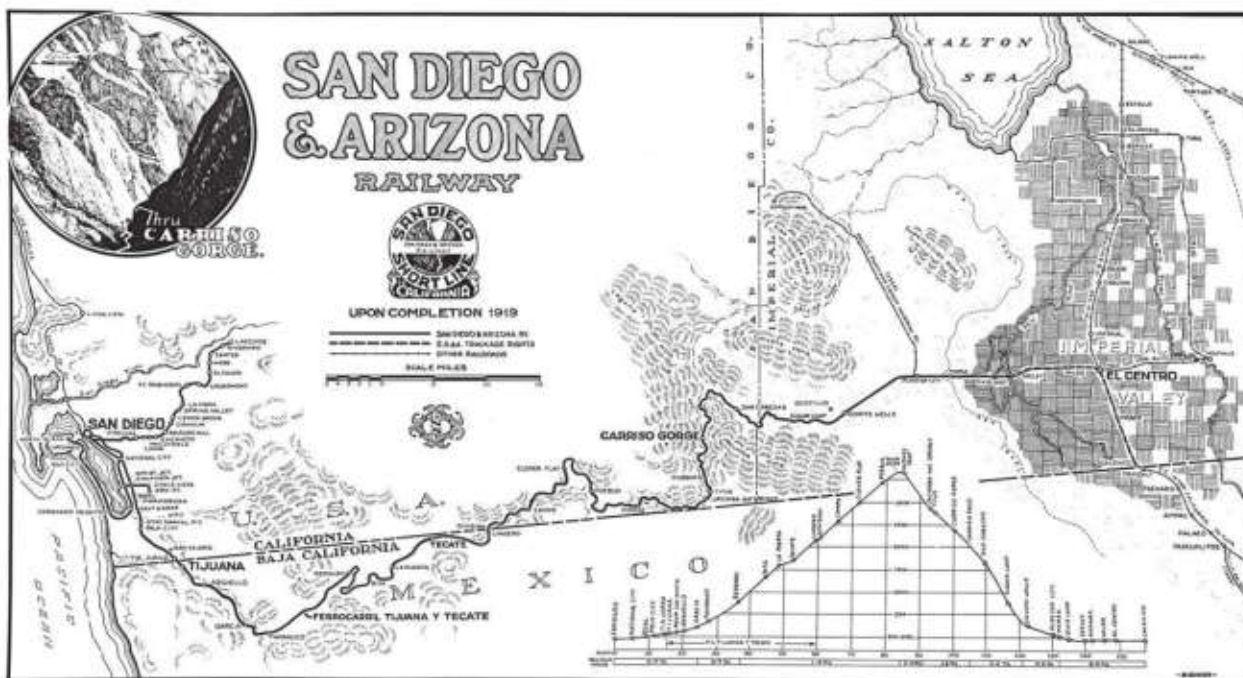
Mapa del Ferrocarril Imposible.