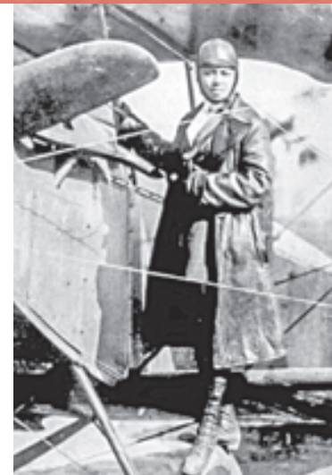
Bessie Coleman. La primera aviadora negra

22:00 TIEMPO DE FILMOTECA UNAM: MUJERES INSUMISAS Gloria De John Cassavetes (Estados Unidos, 1980)