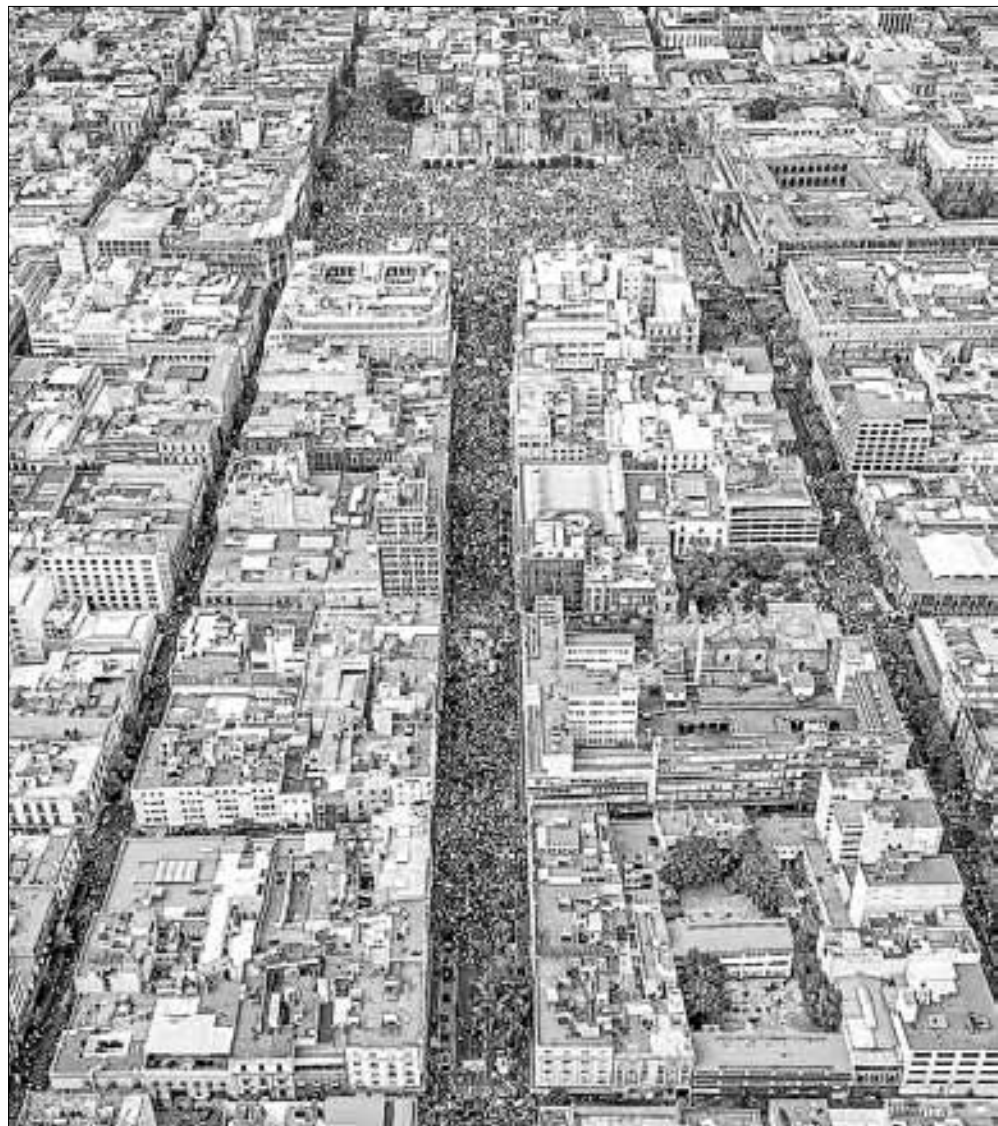
▲ La avenida 20 de Noviembre lució pletórica la tarde del sábado durante el mitin por el 85

AQUÍ LES DEJO la imagen de ese sábado 18 de marzo que no se olvida.