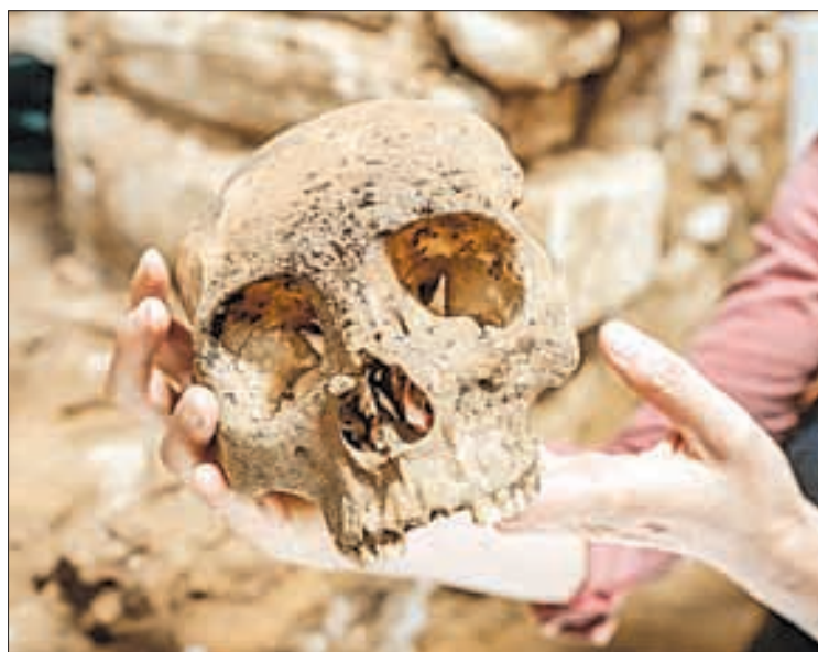
▲ Cráneo encontrado en uno de los enterramientos que reportó el director del INAH en la conferencia matutina del presidente Andrés Manuel López Obrador. Diego Prieto informó que el sitio del hallazgo forma parte del tramo 1 de la ruta del Tren Maya.

En este tramo, que va de Palenque a Escárcega, se han registrado y preservado, al 20 de marzo, 2 mil 655 bienes inmuebles; 218 bienes muebles, entre elementos de cerámicas, metates, figurillas y ofrendas; 255 mil 683 fragmentos de cerámica; 177 enterramientos humanos, y 38 rasgos naturales asociados al paisaje.