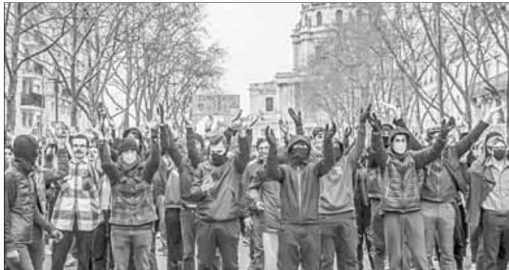
▲ Manifestantes corean consignas contra el gobierno francés, ayer, durante una protesta

Twitter: @cafevega cfvmexico_sa@hotmail.com