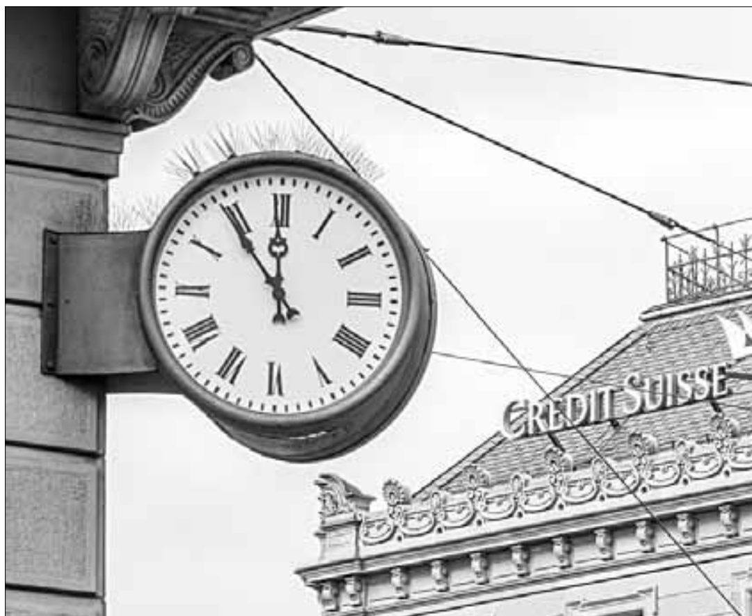
▲ Los bonos AT1 actúan como amortiguadores si los recursos de un banco caen por debajo de un determinado umbral, porque pueden convertirse en capital o amortizarse, pero, luego de la adquisición de emergencia de Credit Suisse, su cotización se está evaporando.