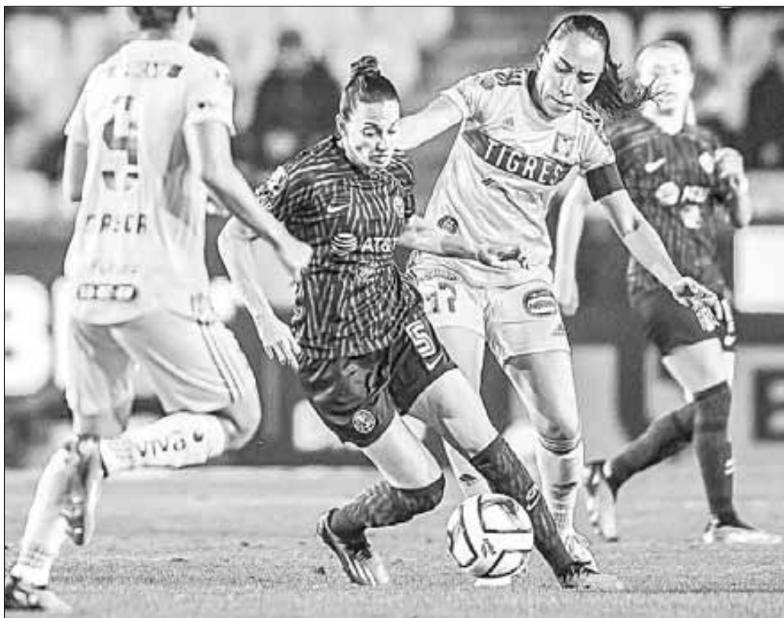
▲ Tigres derrotó al América, con un penal en tiempo de compensación, una semana antes del clásico regio.