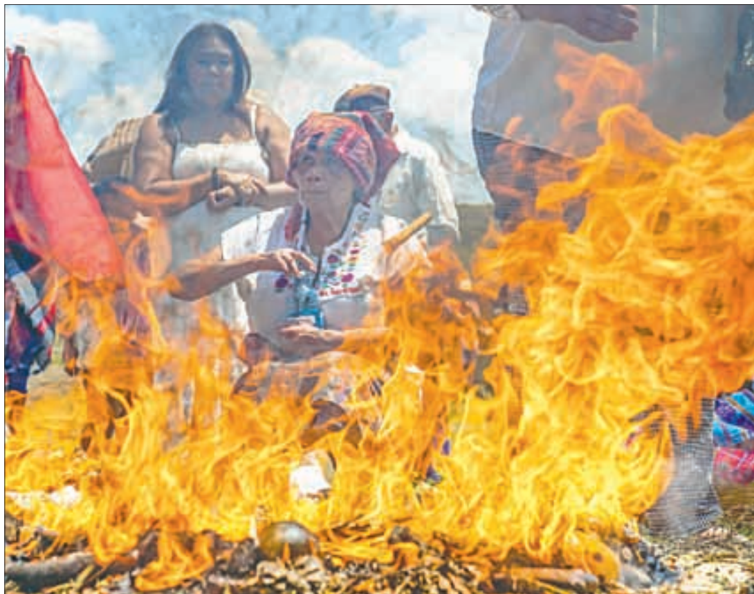
▲ Indígenas realizan una ofrenda al fuego durante la celebración del equinoccio de primavera en el sitio arqueológico San Andrés, en el valle de Zapotitán, departamento de La Libertad, El Salvador.