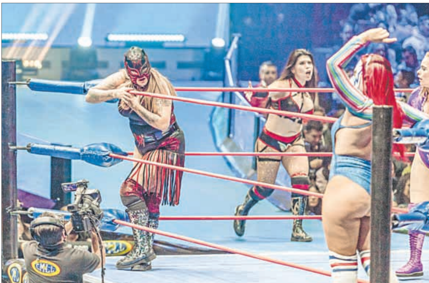
▲ Arriba, aficionadas en la Arena México. Sobre estas líneas, una batalla entre gladiadoras.