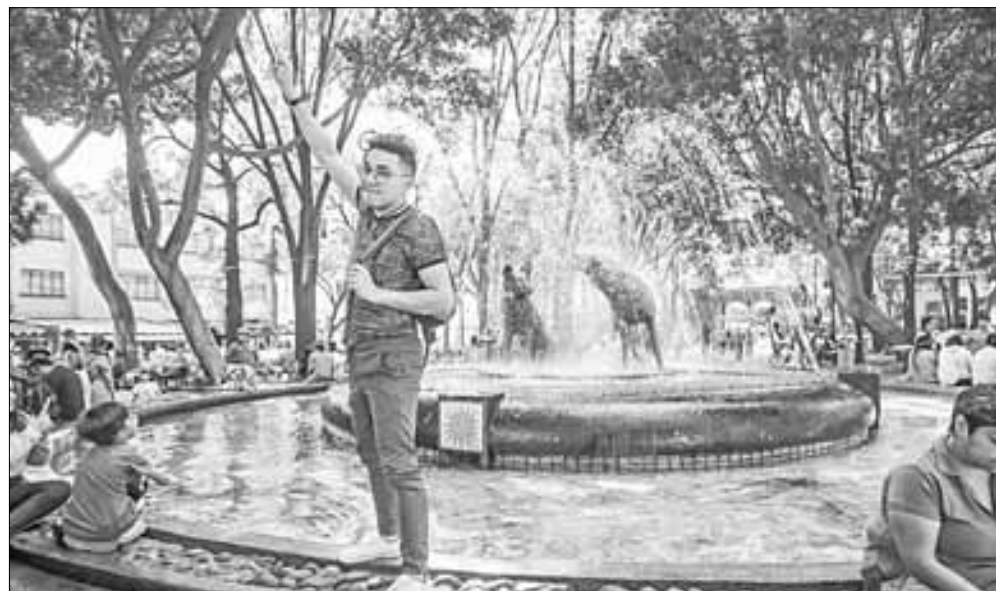
▲ El comienzo de la primavera coincidió ayer con un día de asueto que permitió a muchos

capitalinos disfrutar de paseos. La imagen, en Coyoacán.