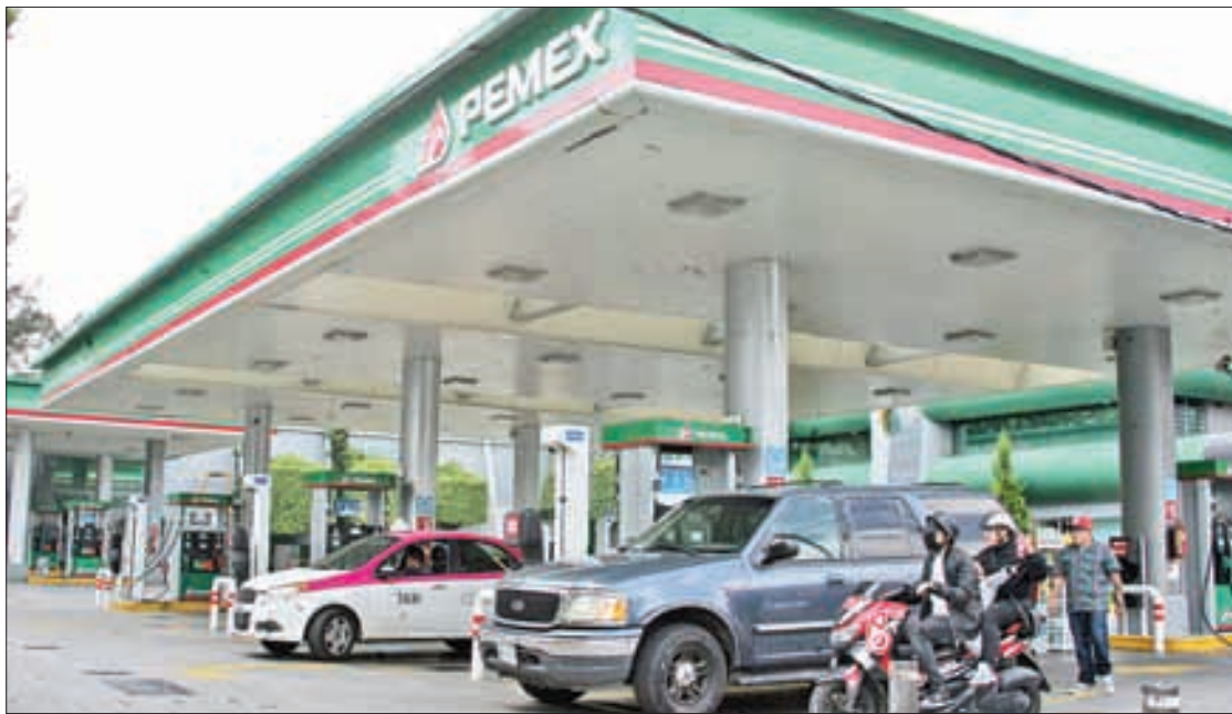
◀ La CRE confía en que este año sumen 500 los nuevos permisos de gasolineras.

Recordó que la inflación energética de México es de 2 por ciento, una de las más bajas en comparación con los países miembros de la Organización para la Cooperación y el Desarrollo Económicos.