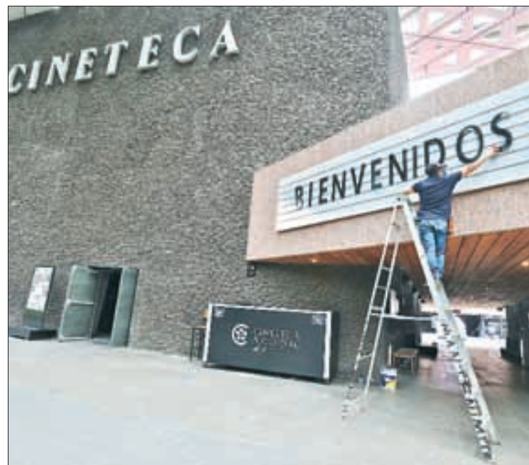
▲ La semana se realizará del 5 al 11 de diciembre en la Cineteca Nacional.

Generar conciencia en nuestro país respecto a la cultura binacional