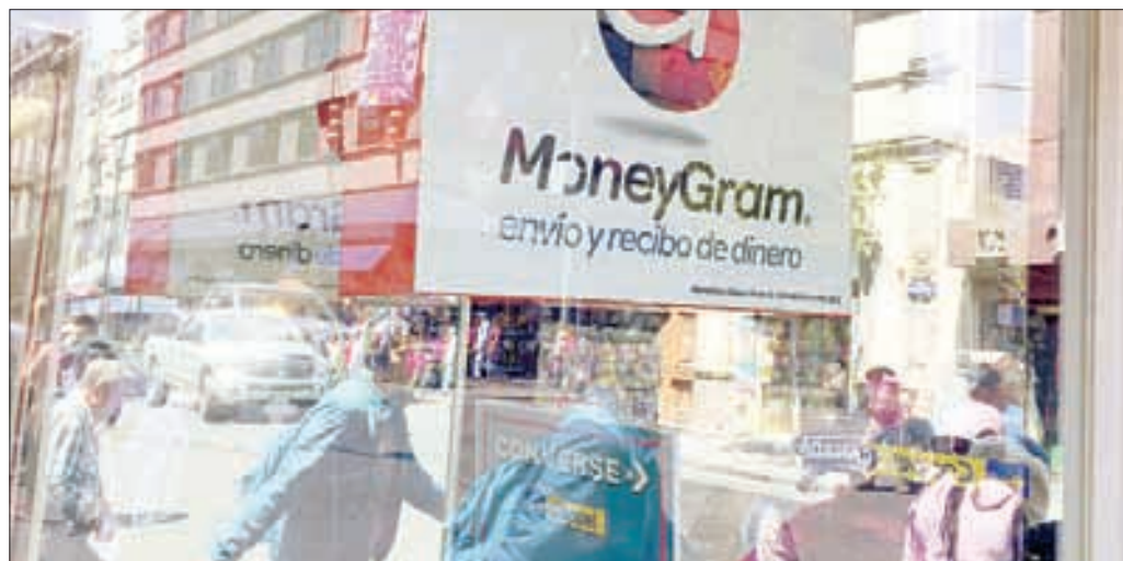
▲ Millones de familias se ven beneficiadas por las remesas que envían los paisanos y ese flujo de recursos permite mejorar su nivel de bienestar.