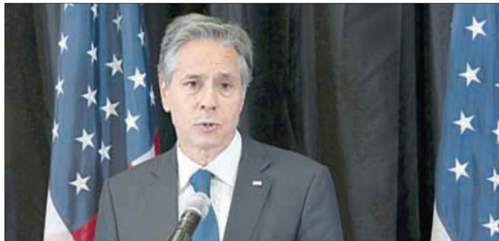
▲ Para el Departamento de Estado, encabezado por Antony Blinken, existen dos