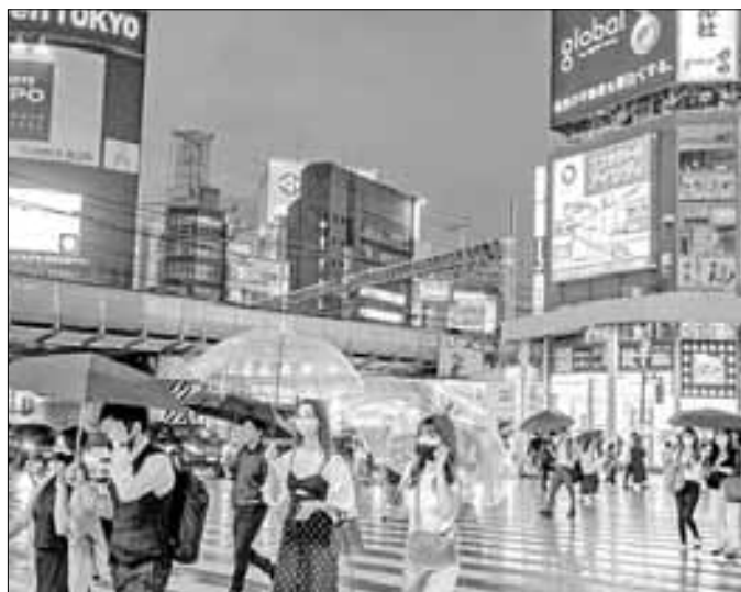
▲ La vivienda en Japón, país con casi 126 millones de personas, es uno de los principales problemas, ya que son muy pequeñas y caras, sobre todo en las zonas urbanas como en Tokio.