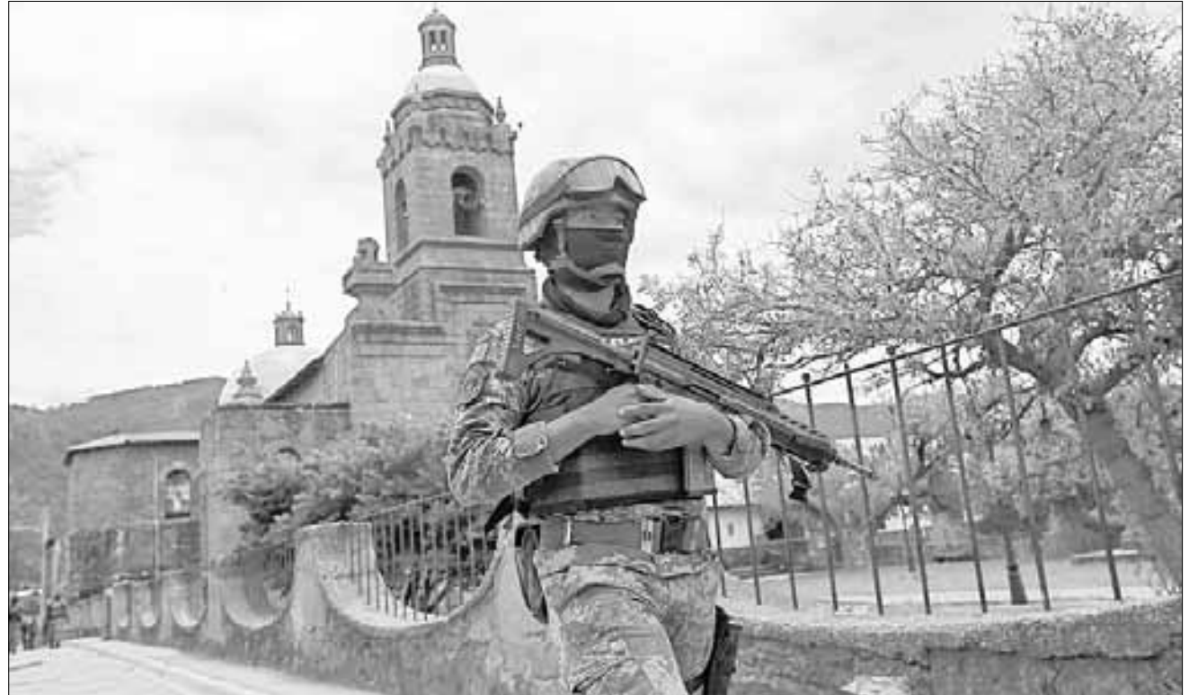
▲ Un soldado vigila afuera de la iglesia de Cerocahui.

En 1900, 133 años después de su expulsión, los jesuitas regresaron a la