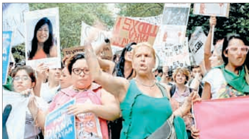
▲ Fotograma del documental de Claudia Vásquez Haro.

Para la directora del filme, la legislación vanguardista argentina contrasta mucho con la contrarreforma derechista que en Francia impulsaron por la misma época, en manifestaciones multitudinarias, los detractores del matrimonio igualitario y otros derechos de las minorías sexuales. La paradoja es clara: en un país latinoamericano tachado de machista, los avances en derechos sexuales y reproductivos pueden y suelen ser más contundentes que en la propia civilización eurocentrista que presume ser la mayor defensora de los derechos humanos. Si en un primer tiempo el documental de Isabelle Solas describe con detalle el ambiente de asambleas y protestas callejeras (desde el colectivo trans hasta las marchas feministas de la marea verde), en una suerte de panorámica de la disidencia queer, un tanto al estilo de la cinta 120 latidos por minuto (Robin Campillo, 2017), paulatinamente se va afianzando el tema que más interesa a la cineasta: la reivindicación del cuerpo como un espacio de libertades. El lema detrás del título estuvo presente en las marchas feministas argentinas, “Tu cuerpo es tu campo de batalla”, y hace referencia lo mismo a la interrupción voluntaria del embarazo, un derecho vulnerado hoy en Estados Unidos, que a la libre elección de una identidad de género distinta a la consignada en el nacimiento. Según afirma una militante trans en la cinta, para una persona transgénero la identidad es algo indis-