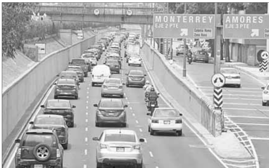
▲ La paciencia es la mejor virtud cuando se maneja en el Viaducto.