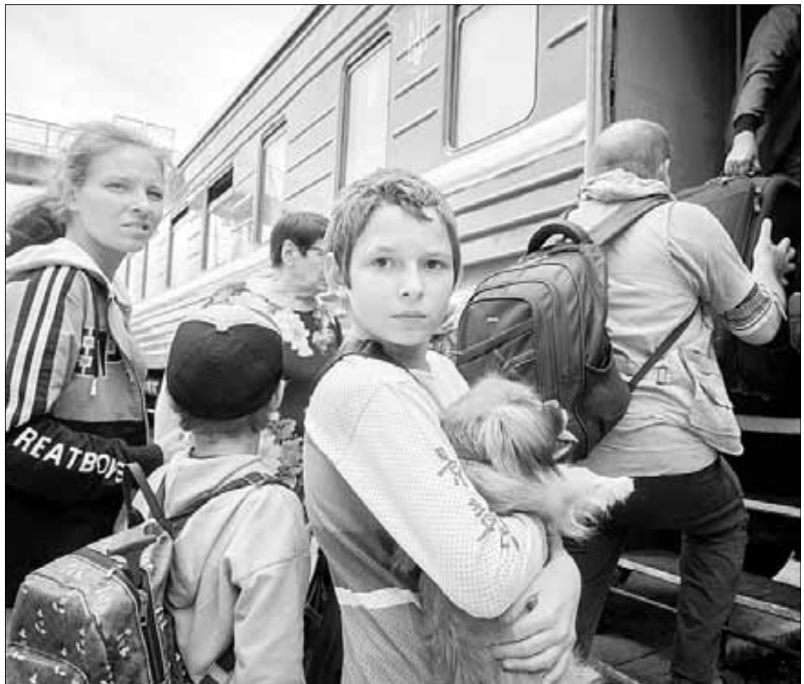
▲ De 160 mil habitantes que Severodonetsk tenía antes de la guerra, ahora sólo quedan unos 12 mil, señala el gobernador de la región de Lugansk, Serguei Gaidai. En la imagen, una familia es evacuada de la zona de guerra en Pokrovsk, al este de Ucrania.

Es difícil saber si estamos en la antesala de que se repita la historia, cuando una eventual situación desesperada de un número elevado de soldados, que todavía es una posibilidad que no se ha dado, podría influir en que el presidente Volodymir Zelensky tire la toalla y pida negociar un alto el fuego bajo condiciones que no son las que él quisiera. O no hacerlo y sacrificar a sus soldados rodeados, presionado por Estados Unidos y la Organización del Tratado del Atlántico Norte, cuyos dirigentes no tienen empacho en afirmar que esta gue-